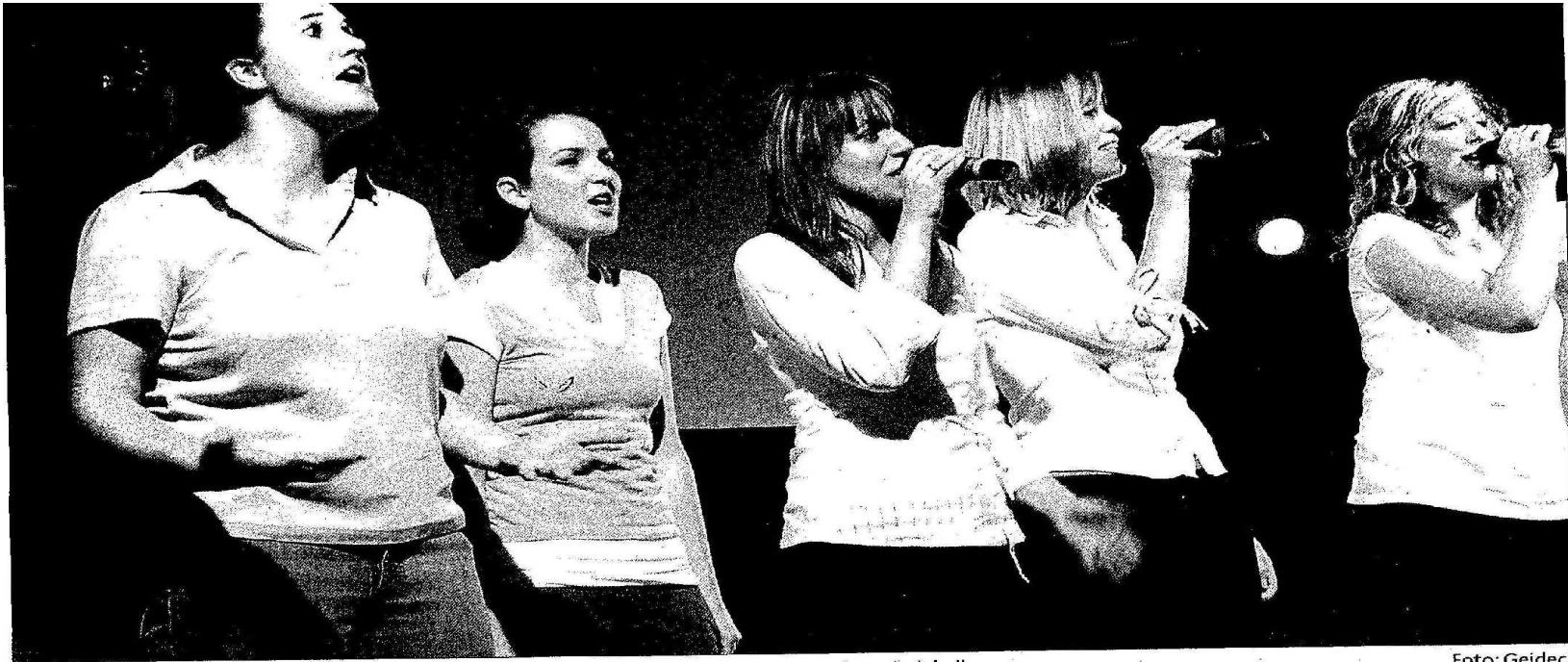
Mit Hingabe sangen die Akteure des Musicals »Der Weg« am Freitagabend in der Mötzingener Gemeindehalle.